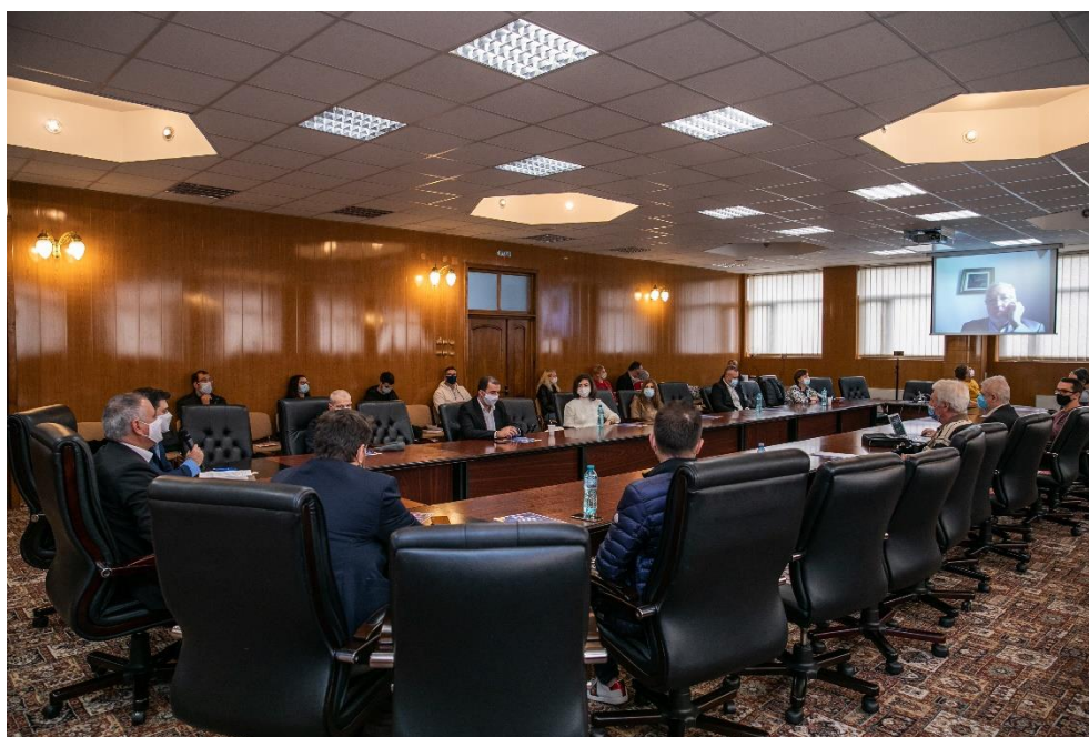
Participanții la eveniment (privire de ansamblu)